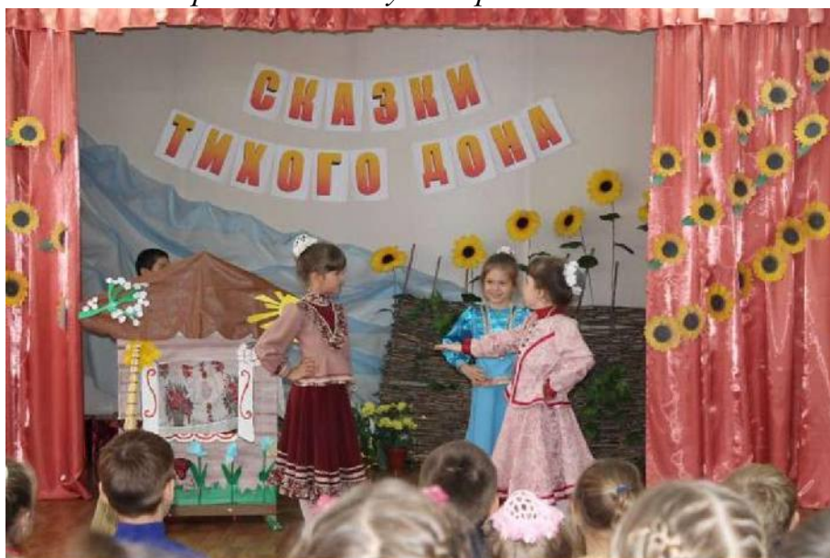
Сказка: «Поречни и жемчуг» Скрипова А.